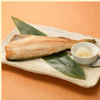
常磐もののほっけの開き 半身