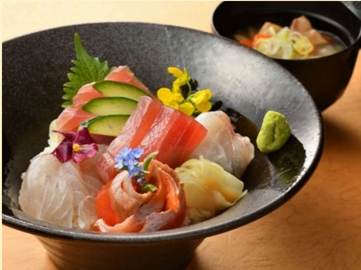
潮目丼 マミーすいとん付 2,580円