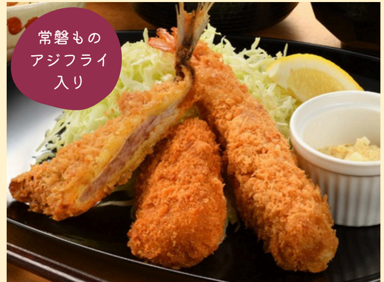
ミックスフライ ご飯・マミーすいとん付 1,900円 単 品 1,530円