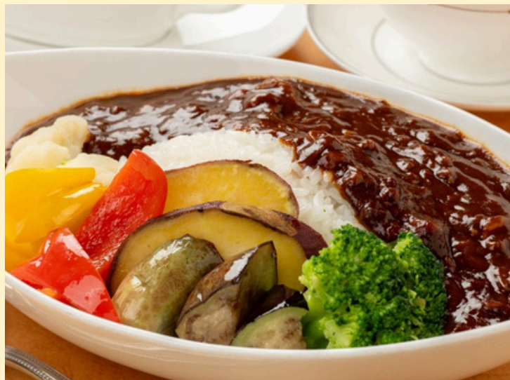
県産野菜のハヤシライス スープ付 1,350円