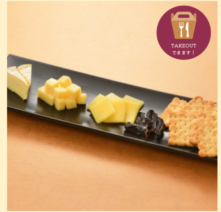
本日のチーズ盛り合わせ