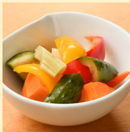
契約農家の新鮮野菜を使用した 自家製ピクルス 660円