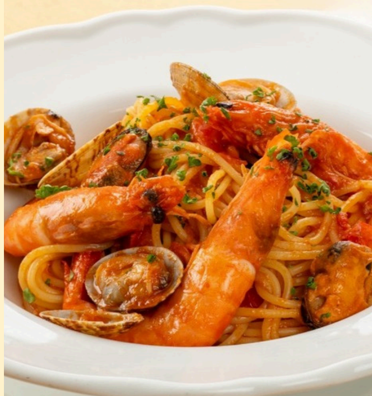
シーフードトマトパスタ スープ付 1,570円