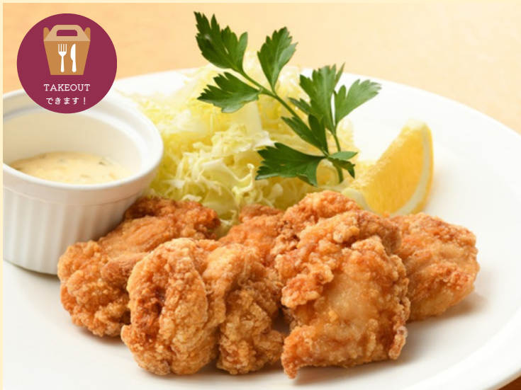
Jヴィレッジ特製唐揚げ ご飯・マミーすいとん付 1,570円 単 品 1,200円 テイクアウト（4個入り） 770円