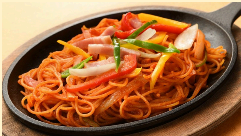
あつあつ鉄板ナポリタン スープ付 1,350円