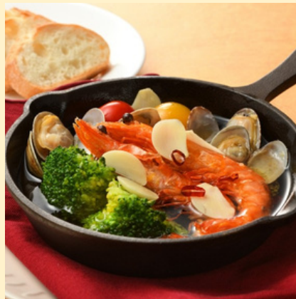
本日のアヒージョ バケット付