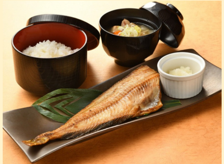
常磐ものほっけ定食 マミーすいとん付 1,500円