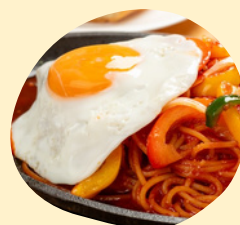
トッピング 目玉焼き + 110円