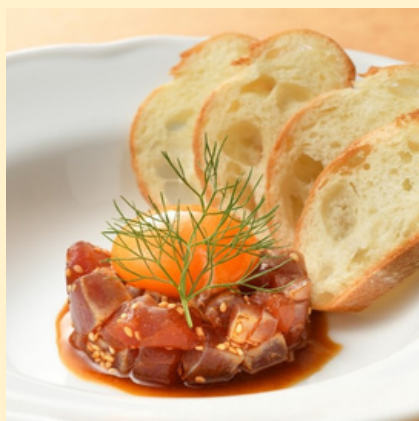
マグロの炙り ユッケ仕立て 990円