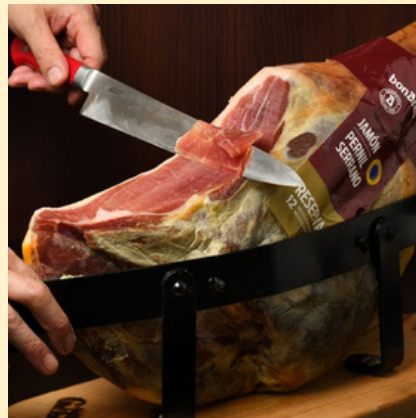
イタリア産プロシュート スモール 1,080円 レギュラー 1,650円