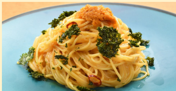
ウニと松川浦産あおさのパスタ スープ付 1,570円