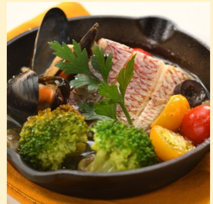
常磐ものの魚を使用した