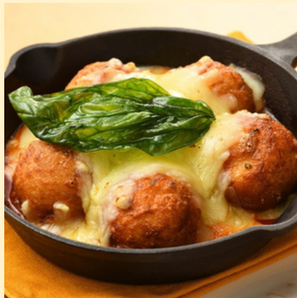
イタリアン風たこやき