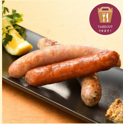
ソーセージ3種盛り合わせ