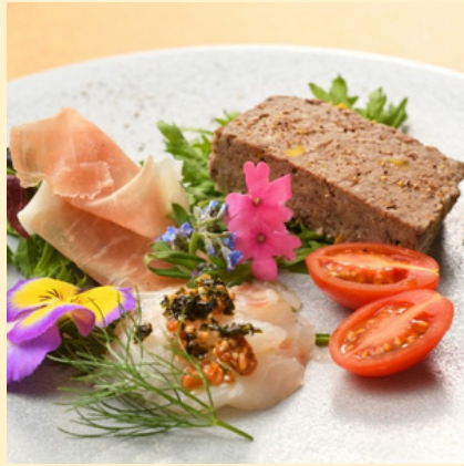
本日の前菜プレート 990円