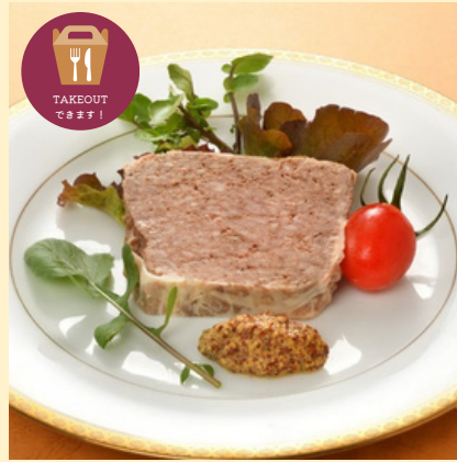
麓山高原豚を使用した自家製 パテ・ド・カンパーニュ 店内 770円 テイクアウト 880円