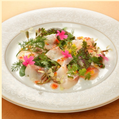
常盤もの白身魚のカルパッチョ 990円