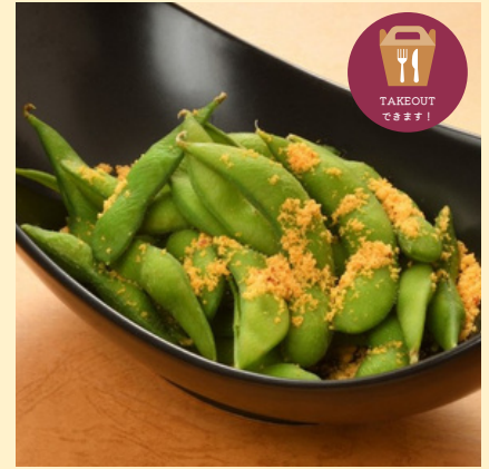
枝豆ペロンチーノ 店内 660円 テイクアウト 770円 * 塩味への変更も可能です