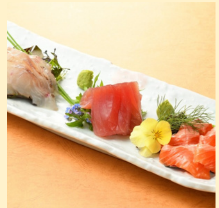
本日の刺身盛り合わせ 1,870円