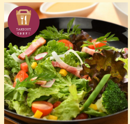
県産野菜の彩りサラダ スモール 440円 レギュラー 990円 テイクアウト 770円