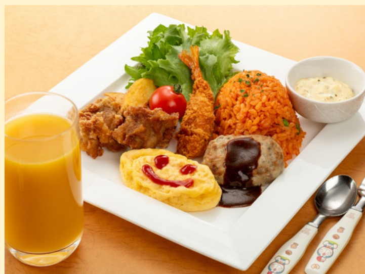
お子さまディナー おもちゃ付