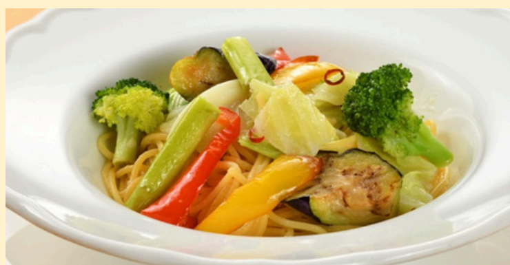
地元季節野菜のペペロンチーノ スープ付 1,350円