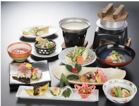
和会席コース 5,500円 (税込)