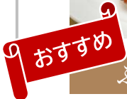
ふくしま満喫膳 3,300円 (税込)