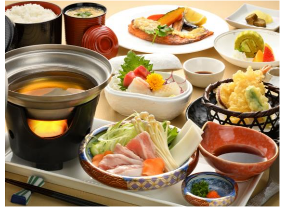
やまゆり膳 2,200円 (税込)