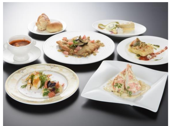
洋食コース 5,500円 (税込)